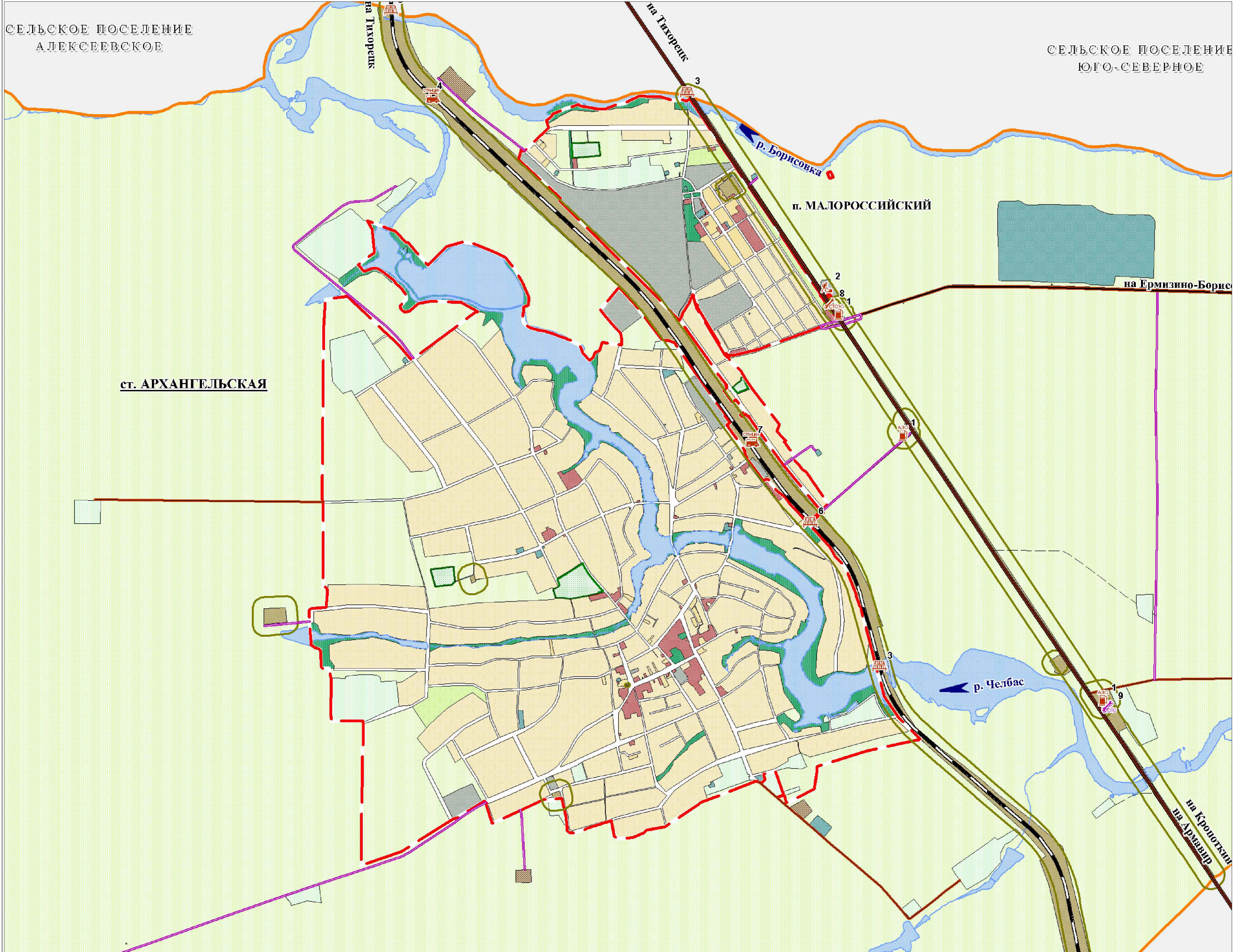
Конфигурация сети дорог п. Малоросийский М 1:5000